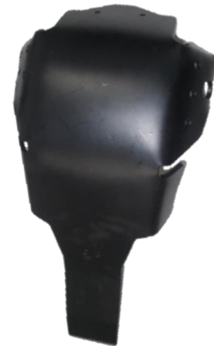
DTC HARD EC ENGINE and LINK GUARD Ref.: 2CP2250114