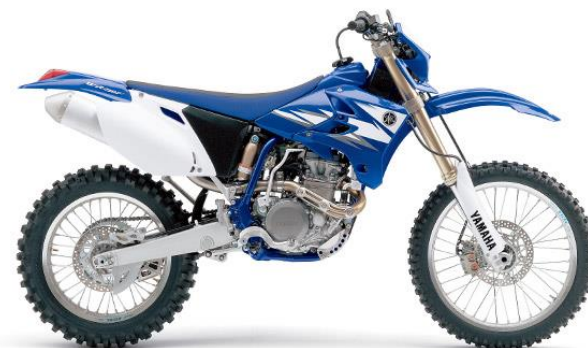
AL EC ENGINE GUARD YAMAHA WR 450 F 2003-2006 Ref.: 2CP0590066